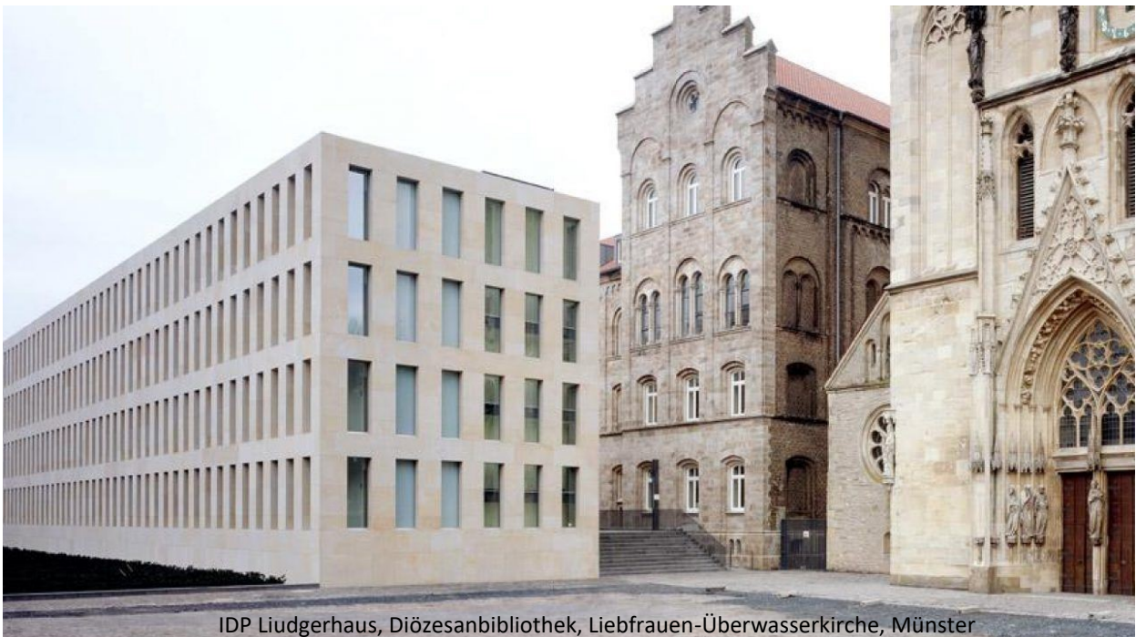
IDP Liudgerhaus, Diözesanbibliothek, Liebfrauen-Überwasserkirche, Münster