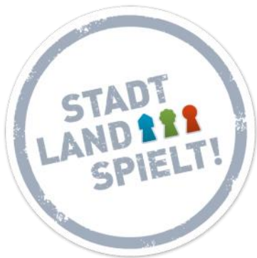
Logo Stadt- Land-Spielt!

Die Initiative Stadt-Land-Spielt! ist ein Projekt zur Förderung des Kulturguts Spiel und bietet eine Gelegenheit, den Tag des Gesellschaftsspiels mit einer Veranstaltung zu nutzen, um das gemeinsame Spielen in den Fokus zu rücken.