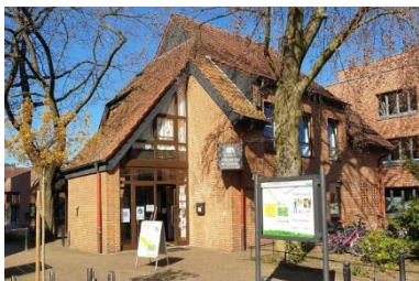
Stadtteilbücherei St. Clemens in Hilstrup

Die Kath. Kirchengemeinde St. Clemens Hilstrup Amelsbüren in Münster sucht im Rahmen einer Nachfolgeregelung zum 1.10.2025 eine neue Büchereileitung.