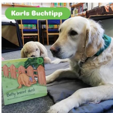
Vorlesehund Karl ist regelmäßig in Stadtlohn im Einsatz

https://www.facebook.com/buechereistadtlohn/photos/das-ist-karl-unser-vorlesehund-wenn-er-arbeitet-dann-ist-er-ein-idealer-stiller-/980574994265009/?_rdr