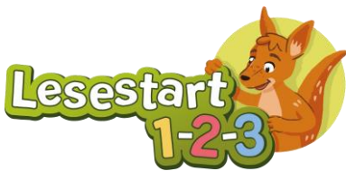
Lesestart 1-2-3- Logo

Im November beginnt die letzte Phase des bundesweiten Programms „Lesestart 1-2-3“ zur frühkindlichen Leseförderung der Stiftung Lesen im Auftrag des bisherigen Bundesministeriums für Bildung und Forschung. Ab dann stehen den Bibliotheken wieder neue Lesestart-Sets mit einem Bilderbuch und Informationen zum Vorlesen für Eltern mit dreijährigen Kindern zur Verfügung, die in Bibliotheken verteilt werden.