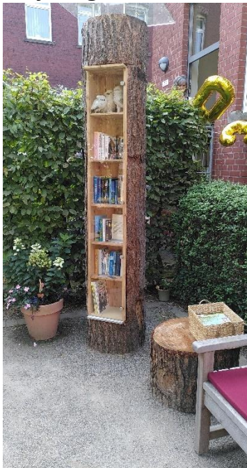
Lesegarten mit Lesebaum

Die Alexius Bücherei auf dem Alexianer-Campus mit seinen Kliniken und Einrichtungen hat am 15. August nicht nur ihr 30jähriges Bestehen gefeiert, sondern auch einen Lesegarten mit Bücherbaum eröffnet. Anfang 2025 konnte ein Tischler gefunden werden, der einen 3m langen Baumstamm aus Lärche fand und in ein Bücherregal verwandelte.