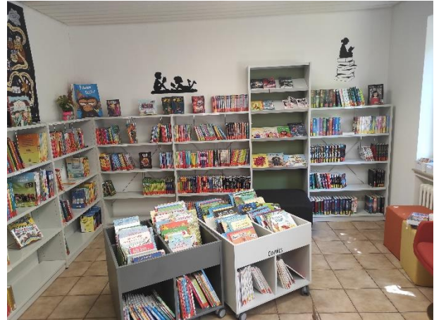
Foto: Erhöhung der Aufenthaltsqualität durch flexible Sitzmöglichkeiten (rechts)