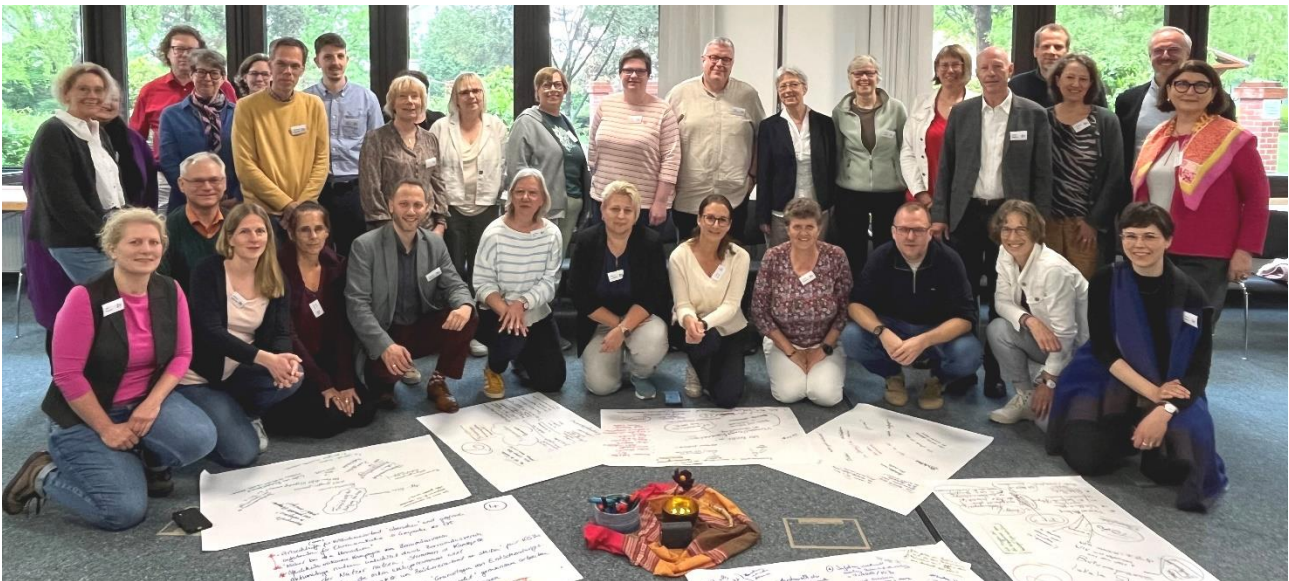
Foto: Teilnehmende des Vorschalttages

Die Katholische Büchereiarbeit bildet ein starkes Netzwerk und erfolgreich umgesetzte Gemeinschaftsprojekte wie das Statistikportal sind positive Beispiele für Synergieeffekte.