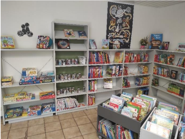
Foto: Medienvielfalt in der Kinderbibliothek