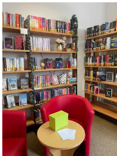
Foto: Eine schöne Lesecke mit einem durch Praktikanten gestalteten Regal im Hintergrund.

Leiterin Annette Fricke über die schönen Momente der Büchereiarbeit: "Sehr viel Freude macht es, wenn man sieht, wie die Augen der Kinder strahlen, wenn sie mit dem ausgesuchten Buch nach Hause gehen - auch wenn es schon öfter ausgeliehen war. Wenn der vorbestellte Tonie abgeholt werden kann. Die Arbeit mit Menschen macht sehr viel Spaß ..."