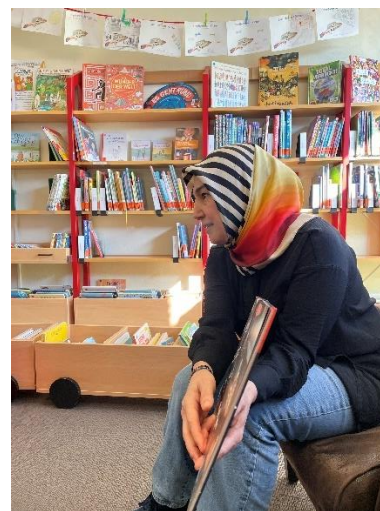
Mitarbeiterin liest vor