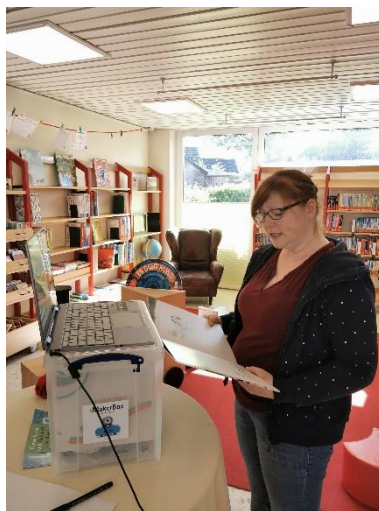
Digitale Treffen während Corona