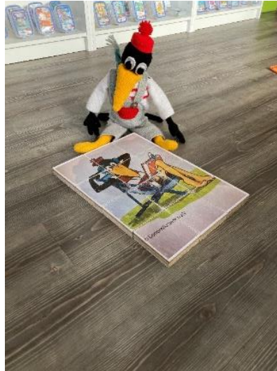
Bibfit-Maskottchen Fridolin mit dem Fridolin-Puzzle