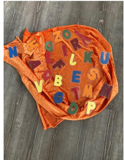
Tuch mit den Anfangsbuchstaben der Kindernamen