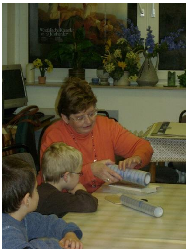
Mitarbeiterin erklärt, wie Bücher eingebunden werden