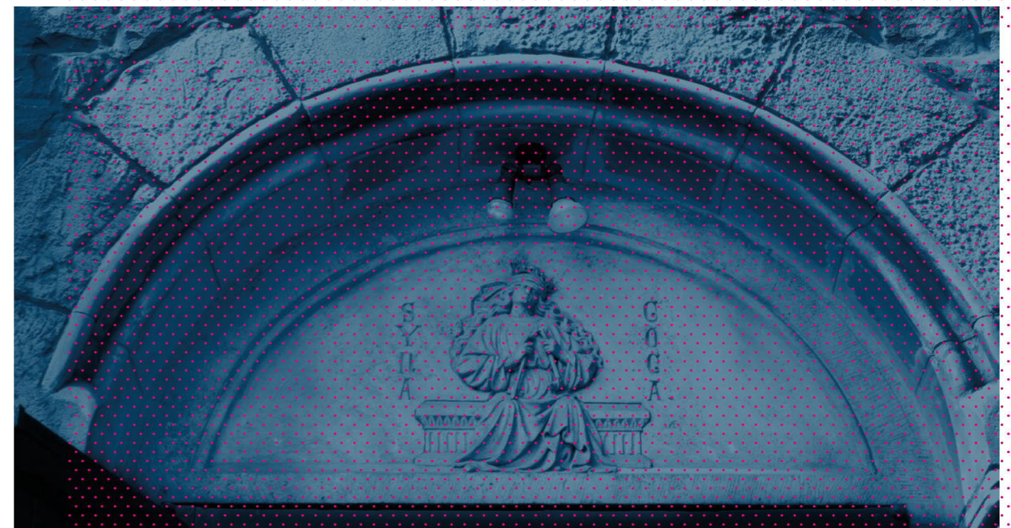
Abb. 1+2 – Aachen-Eilendorf, St. Severin, Portale mit Darstellung der Ecclesia und Synagoga