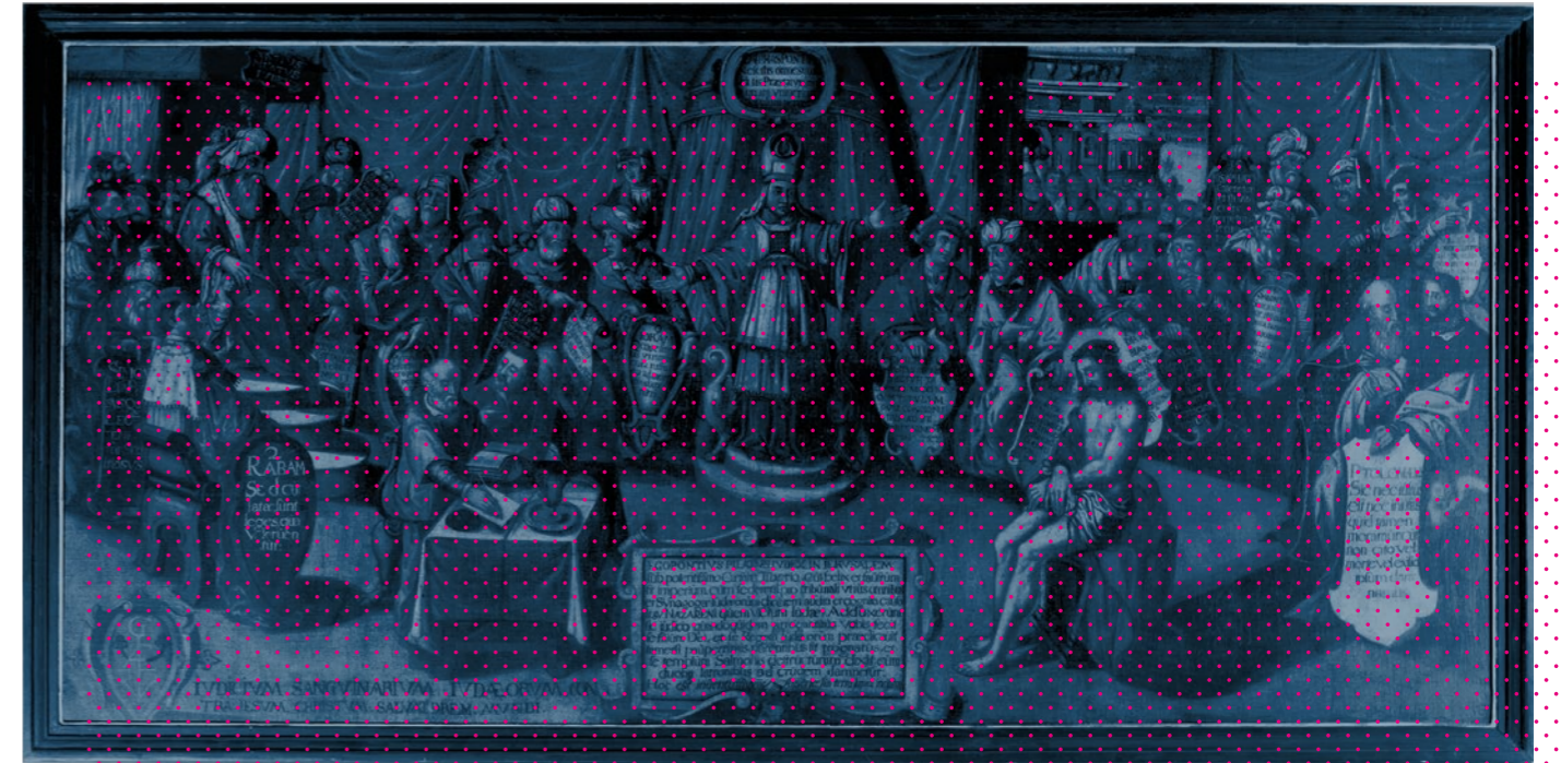
Abb. 4 – Erpel, St. Severin, Gemälde mit Darstellung Jesus vor dem Hohen Rat

Ein populäres Motiv, das die Schuldfrage am Tod Jesu thematisierte, waren Darstellungen „Jesus vor dem Hohen Rat“ (Abb. 4). Üblicherweise liegt der Fokus auf dem Hohepriester Kajaphas und den Mitgliedern des Hohen Rates, die angeblich einstimmig für den Tod Jesu plädieren. Jesus steht, hier meist bereits mit entblößtem und gemartertem Körper, vor dem Rat, während Pilatus seine Hände in Unschuld wäscht. Kajaphas und die Mitglieder des Hohen Rates sind dabei oft an ihren Kopfbedeckungen zu erkennen.